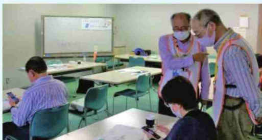
デジタル活用支援員として総務省から認定を受けた講師陣