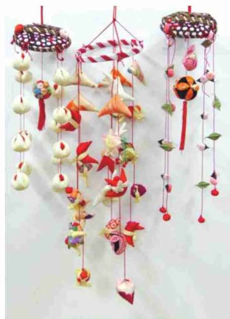
↑雄川会長による手作りのつるし雛

最後になりますが、今年の干支は寅年です。干支にちなんで、コロナ禍を乗り越え何か新しいことにトライし、会員の皆様が、ますますご活躍いただきますことをお願い申し上げます。私の年頭のご挨拶といたします。