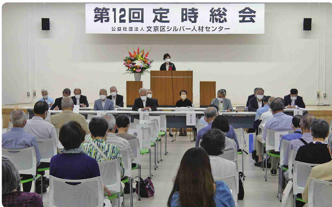
第12回定時社員総会が6月21日(火)に開催されました。 開催報告は、2ページ目をご覧ください。