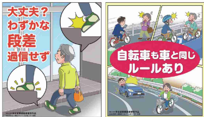
令和4年度最優秀作品

なお、連合本部にて最優秀賞に選出されたものは、啓発ポスターとして活用されます。奮ってご応募ください。