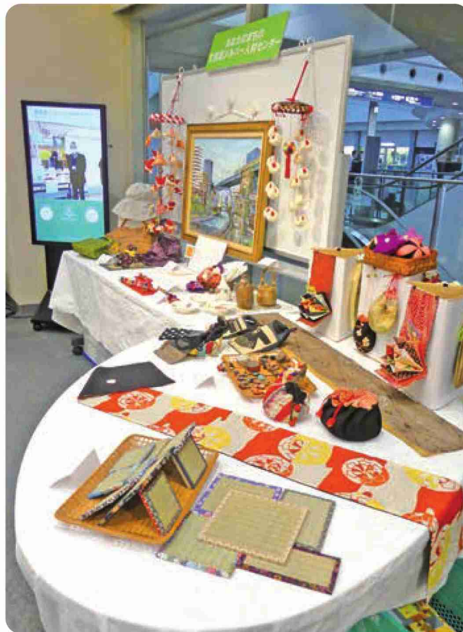
令和4年11月19日(土)・20日(日)開催「いきいきシニアの集い」シルバー会員による展示作品 ※詳細は4ページ目をご覧ください。