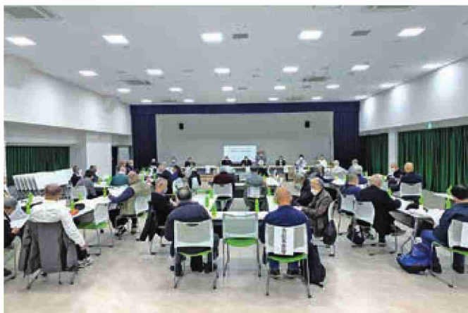
11月30日(水)実施、 駐輪場・放置自転車/地域社会サポートグループ