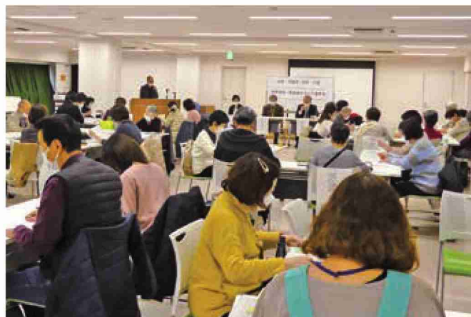
12月14日(水)実施、 派遣・家事援助・シルバー緊急隊グループ